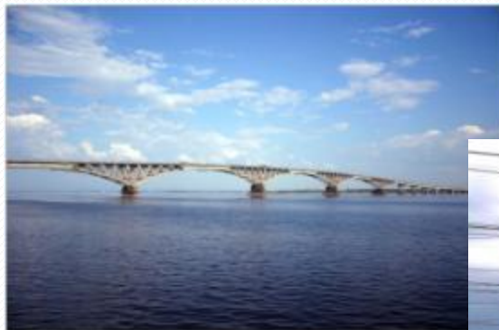
Мост через Волгу