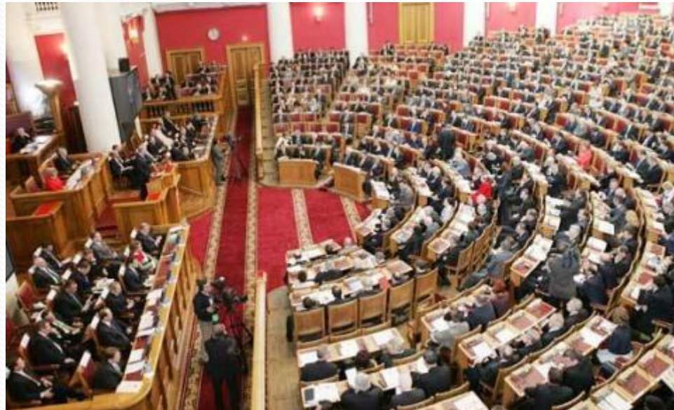
Заседание Государственной Думы РФ

Ни один коллектив, от семьи до государства, не может существовать без информационного обмена.